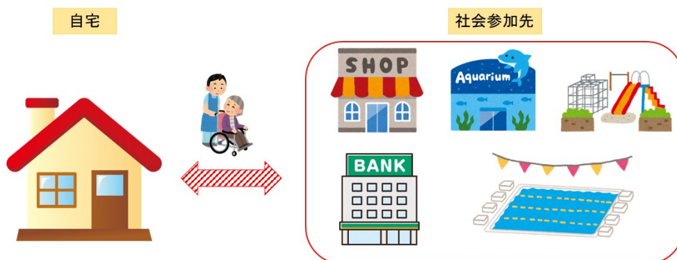
図 1 移動支援のイメージ