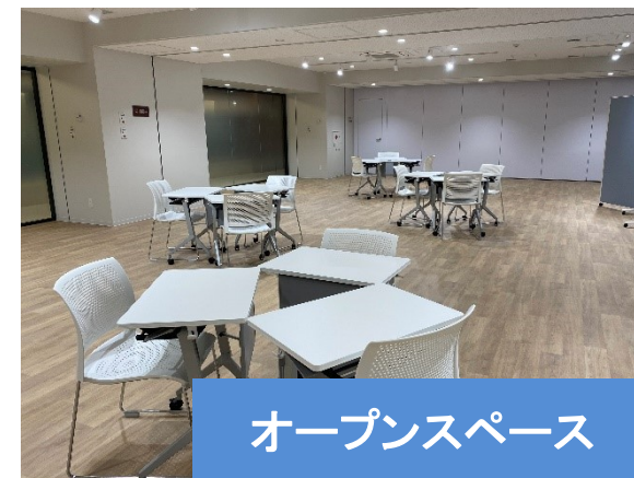
オープンスペース