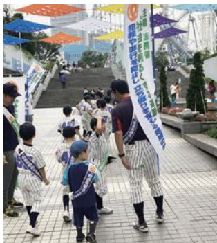
東京ドーム周辺広報啓発活動 (令和元年7月)

東京ドーム周辺広報啓発活動、文京区社会を明るくする大会については、新型コロナウイルスの感染状況を注視し、状況に応じて中止または規模の縮小を検討します。