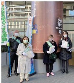
規模を縮小して行われた昨年の文京シビックセンター周辺広報啓発活動 (令和2年12月)