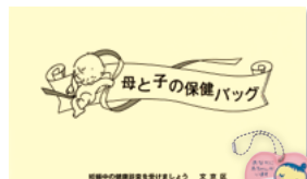
母と子の保健バッグ