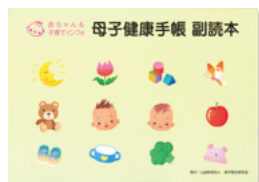
母子健康手帳 副読本