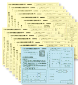
妊婦健康診査受診票(14枚)