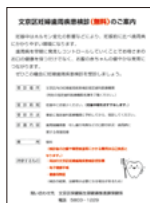
文京区妊婦歯周疾患検診のご案内