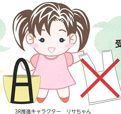
3R推進キャラクター リサちゃん

日本は、ワンウェイ (使い捨て) の容器包装廃棄量 (一人当たり) が世界で二番目に多いんだって! (「国連環境計画2018」)