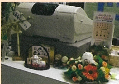
食べきり推進の掲示物