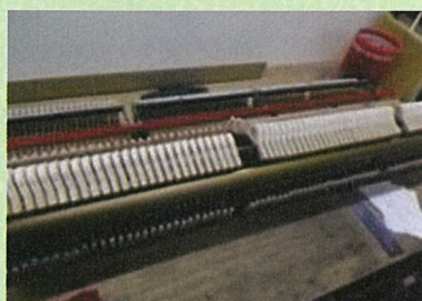
「工房」内の修理の様子