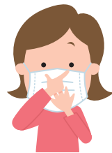
鼻と口の両方を確実に覆う