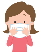
隙間がないよう鼻まで覆う