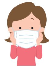
ゴムひもを耳にかける