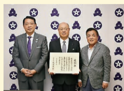
▲東京小石川ロータリークラブに感謝状贈呈

※子ども宅食プロジェクトの対象は、児童扶養手当、就学援助の受給世帯です。利用希望者は左記までお問い合わせください。 子育て支援課 ☎(5803)1353