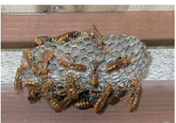
アシナガバチの巣

ハチの巣の撤去方法は、次の方法で行いましょう。①夕方暗くなってハチが巣に戻り、おとなしくなったら行う。②ハチは明るい方に飛ぶ習性があるので、巣を挟んで反対側に照明を置く。③離れた所から、市販のスプレー式殺虫剤を巣穴に向かって約20秒間吹きかける。④ハチがいなくなったら巣を落とし、ビニール袋に入れてごみとして出す。