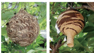
スズメバチの巣(後期) スズメバチの巣(初期)

区では、民家にできたスズメバチの巣に限り撤去のお手伝いをしています。スズメバチとアシナガバチの巣は次のように区別します。