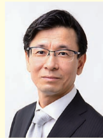
教育長 加藤裕一(かとうひろいち)

(任期 令和元年6月13日～5年6月12日) 平成10年7月教育委員会学校教育部学校適正配置担当課長 12年4月総務部契約管財課長 14年4月企画政策部新公共経営担当課長 15年4月教育委員会学校教育部学務課長 19年4月区民部経済課長 21年4月教育委員会教育推進部参事 22年4月総務部参事 23年6月男女協働子育て支援部長 26年4月企画政策部参事 28年4月区議会事務局局長 30年7月教育委員会教育長