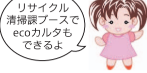
リサイクル清掃課ブースでecoカルタもできるよ

7月1日(月)~9月30日(月) 学校や町会など、地域の団体に打ち水用のひしゃくやのぼり旗を貸出 環境政策課地域環境係 ☎(5803)1276