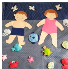
ごろんの赤ちゃんは写真が撮れます