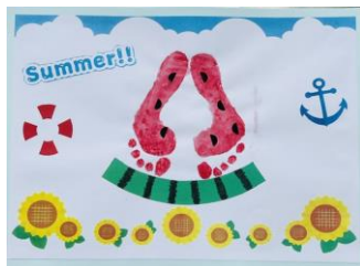
7月はすいかの足型アートを作ります