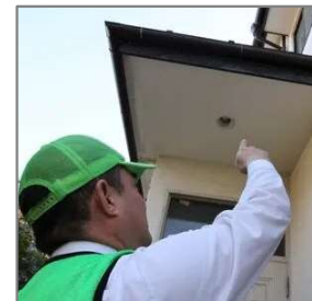
見回り時の目視点検の様子