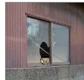
窓が割れた管理不全空家