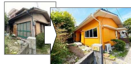
築50年以上の空家をシェアハウスにした例