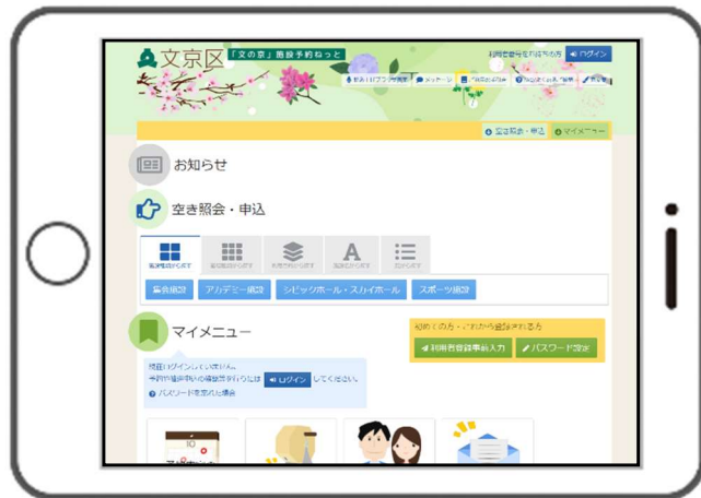
利用者端末イメージ画像