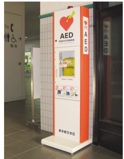
写真：文京シビックセンター 1F