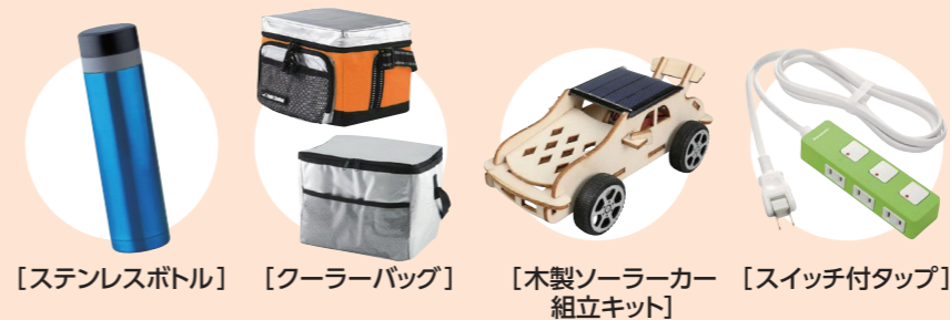
[ステンレスボトル] [クーラーバッグ] [木製ソーラーカー組立キット] [スイッチ付タップ]

デザイン等は変更になる可能性があります。また在庫数によって選べないこともあります。