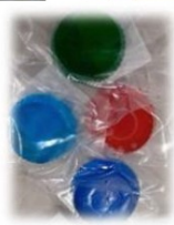
石鹸作り のようす