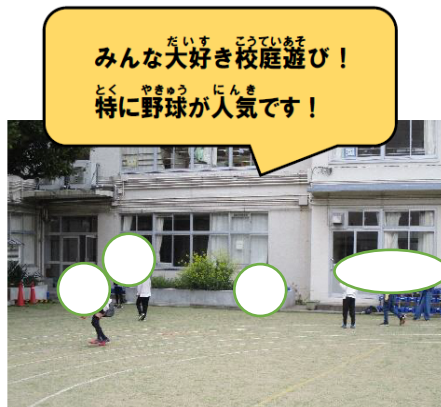
みんな大好き校庭遊び！ とくにやきゅうにんき 特に野球が人気です！