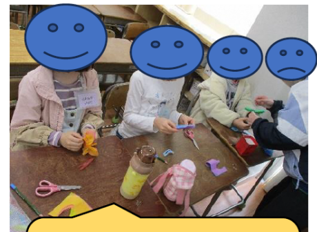
こうさく 工作DAYではお花紙で蝶を作り ました！かわいい作品が出来上 がりました！