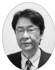
清水教育長 職務代理者