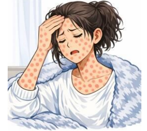
※イラストは文章生成AIにより作成