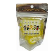
レモネードキャンディ 8個入り