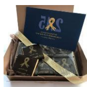
チョコレート 6個入り