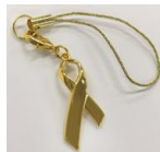
ゴールドリボンチャーム

※こちらで紹介しているチャリティグッズの内容やパッケージ、デザインなどは変更になる場合がございます。