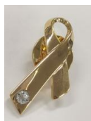
ゴールドリボンバッジ (スワロフスキー付)